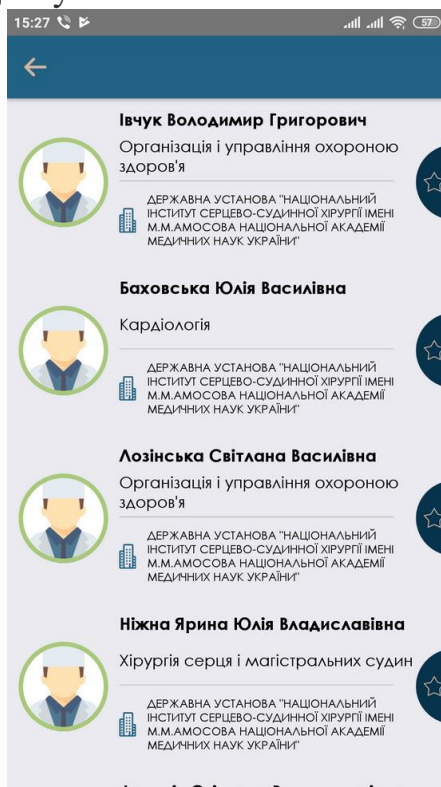
Перегляд зареєстрованих лікарів по обраному медичному закладу

Обов'язковою умовою для користування сервісами є наявність персонального номера мобільного телефону , за допомогою якого пацієнт авторизується в додатку.