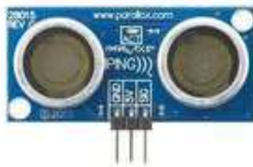
Рисунок 6.1 – Зовнішній вигляд ультразвукового датчика відстані

Ультразвуковий датчик відстані 28015 має наступний вигляд рис.6.1.