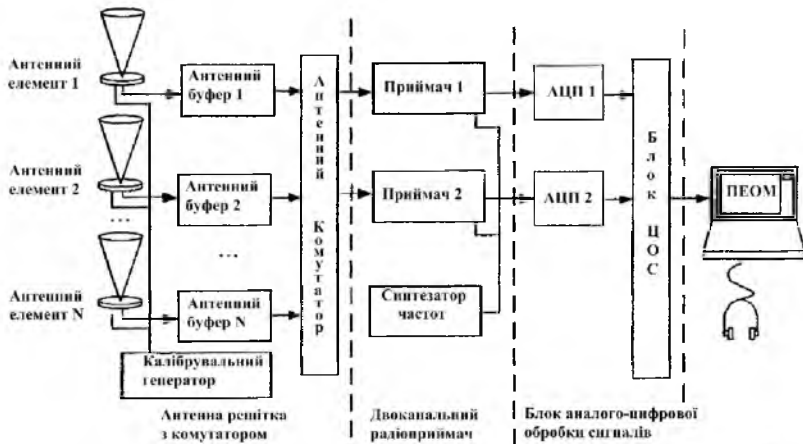
Рис. 4.1 – Структурна схема багатоканального кореляційно-інтерферометричного радіопеленгатора

періодичного калібрування за допомогою тестового зондуєчого сигналу невеликої потужності, що подається в приймальні канали.