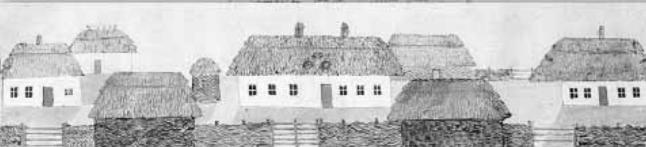
Exemplaire des chaumières des paysans des districts de Kiev et d'autres. Окремасть крестинських жилищъ въ уездахъ Кіевско-мъ, Засулковско-мъ и прех.