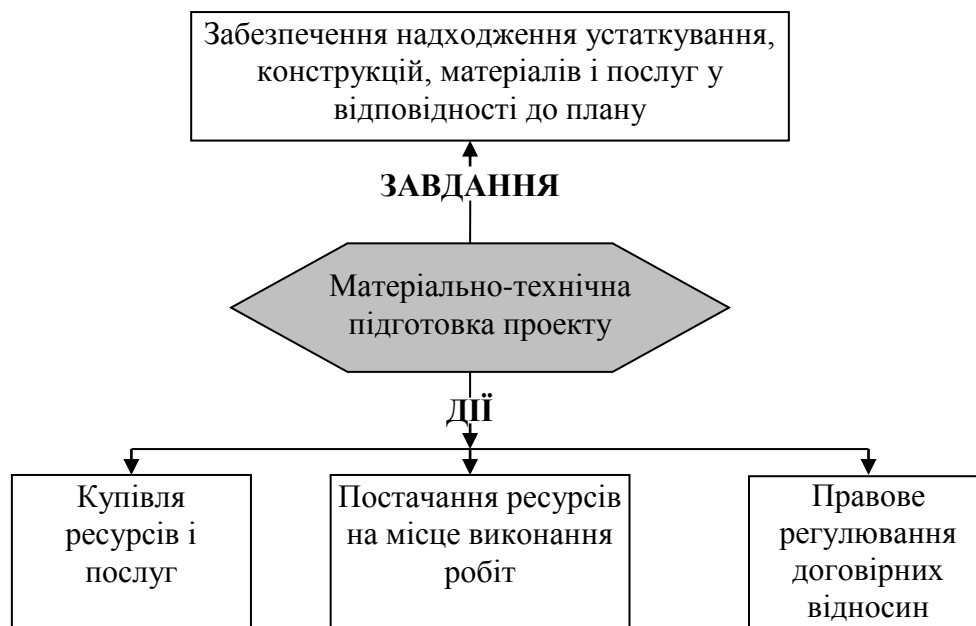
Рис. 5.1 Зміст матеріально-технічної підготовки проекту

конкурсній основі, постачання ресурсів на місце виконання робіт і правове регулювання договірних відносин (рис.5.1).