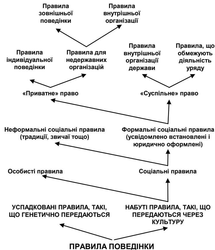
Рис. 3. Класифікація правил поведінки (за В. Ванбергом)