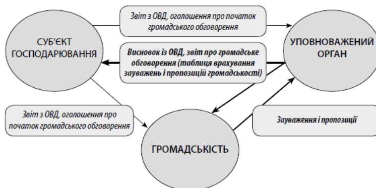
Рис. 12.1. Рух документів під час громадського обговорення на етапі аналізу звіту з ОВД

На стадії скоупінгу зібрані уповноваженим органом (після опублікування повідомлення у реєстрі) зауваження і пропозиції громадськості пересилаються суб'єкту господарювання, який при підготовці звіту з оцінки впливу на довкілля враховує повністю, враховує частково або обґрунтовано відхиляє зауваження і пропозиції громадськості, надані в процесі громадського обговорення обсягу досліджень та рівня деталізації майбутнього звіту з ОВД. Інформація про врахування зауважень і пропозицій громадськості відображається суб'єктом господарювання у звіті із ОВД. Належність врахування суб'єктом господарювання зауважень і пропозицій громадськості на цій стадії перевіряється уповноваженим органом під час аналізу звіту із ОВД та підготовки звіту про громадське обговорення.