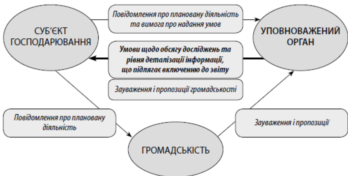
Рис. 8.1. Схема руху документів під час визначення обсягу досліджень та рівня деталізації

4) щодо опису і оцінки можливого впливу на довкілля планованої діяльності – умови щодо використання для оцінки впливів конкретних методологій.