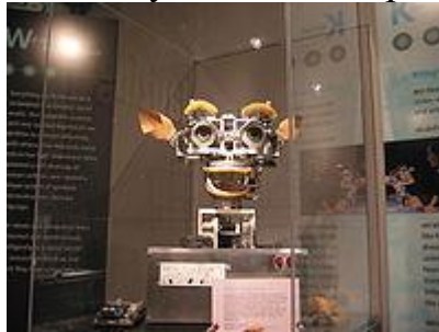
Kismet, робот з базовими соціальними навичками

ASIMO — Інтелектуальний гуманоїдний робот від Honda, використовує сенсори та спеціальні алгоритми для уникнення перешкод та ходіння сходами.