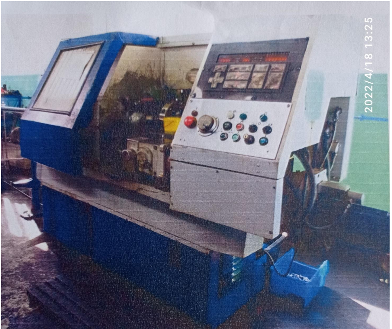
Рис. 1.2. Токарно-револьверний верстат моделі 16К20Ф3 з оперативною системою (ОС) ЧПУ Електроніка НЦ-31