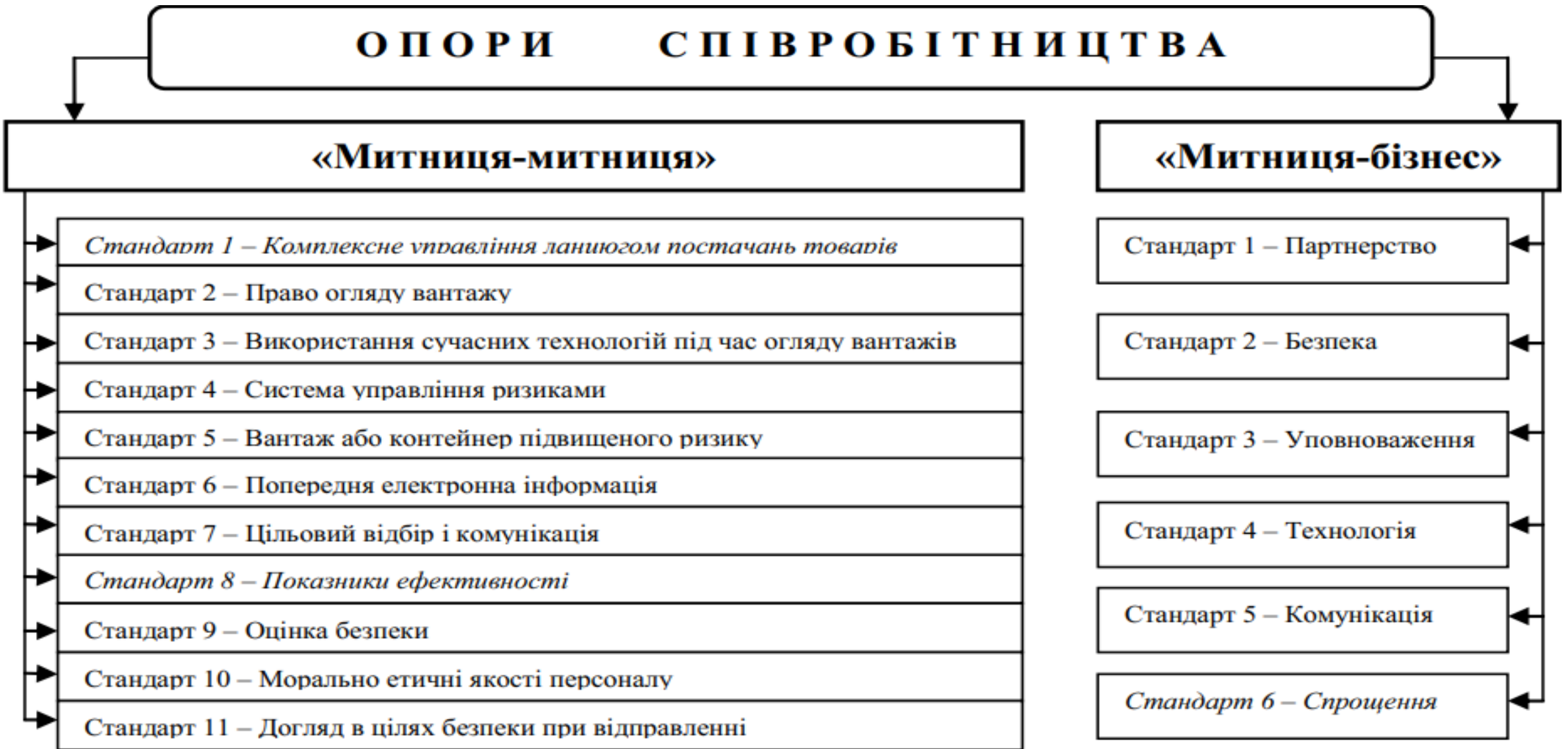
Рис. 2. Опори співробітництва Рамкових стандартів