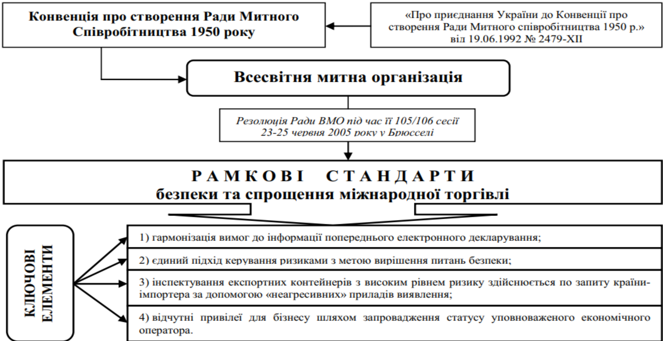
Рис. 1. Ключові елементи Рамкових стандартів