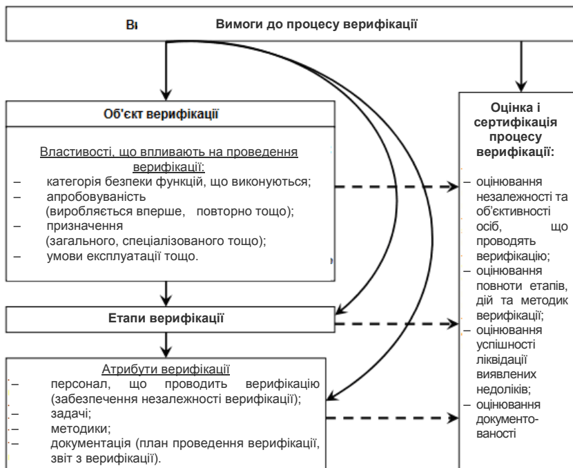
Рис. 6.1. Узагальнена схема процесу верифікації процесів у ГВС