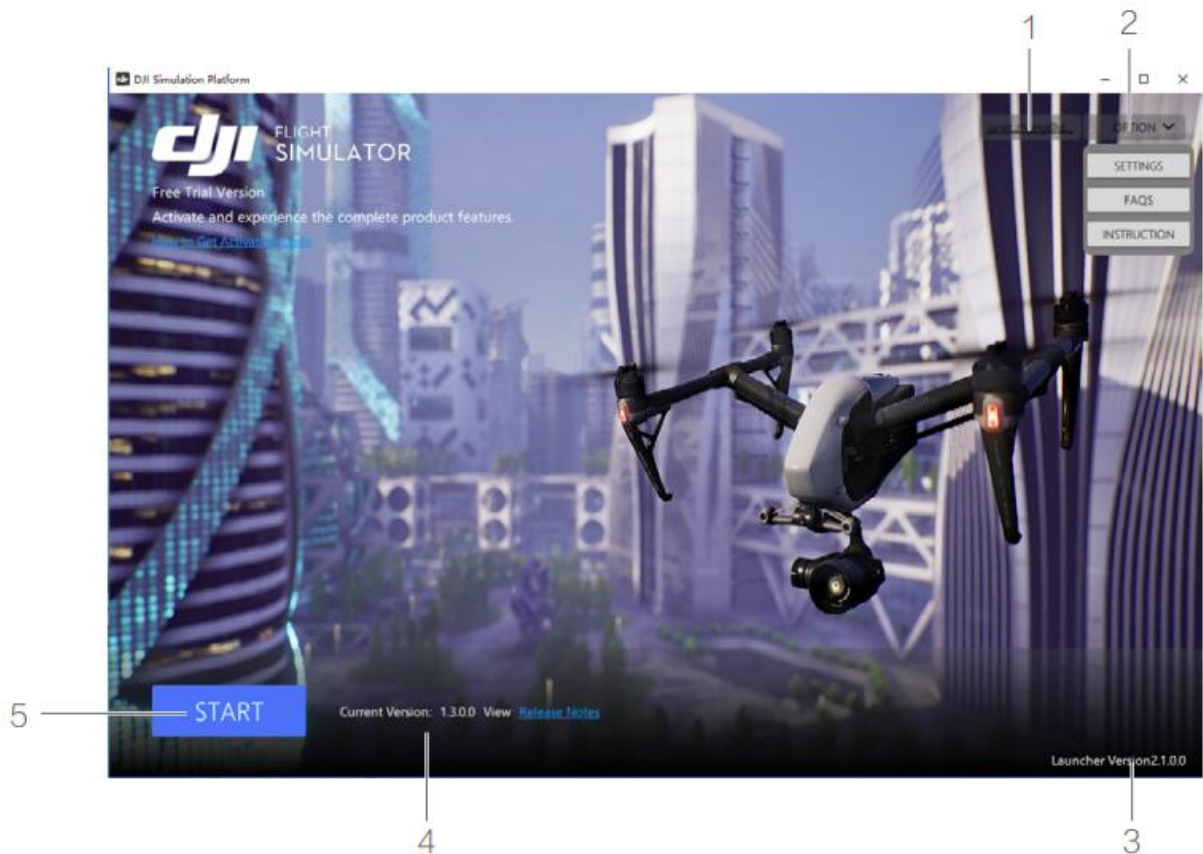
Рис. 1.1. Початковий екран запуску симулятора

На головному екрані та його підекранах можна використовувати лише пульт дистанційного керування та клавіатуру (див. рис. 1.2).