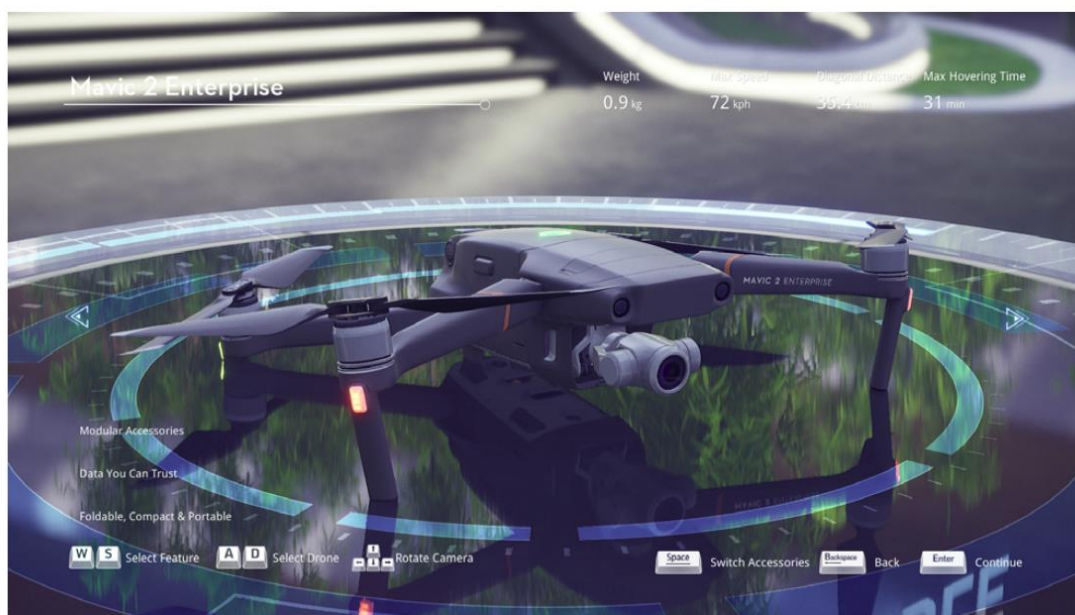
Рис. 1.4. Зовнішній вигляд інтерфейсу вибору дрона

Виберіть літак для використання в навчальних модулях, рис. 1.3.