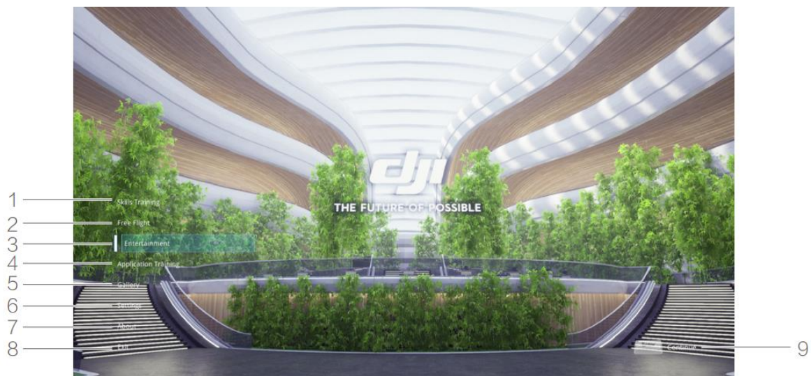
Рис. 1.2. Початковий екран симулятора

7. Перегляньте положення та умови, а також інформацію про команду, яка стоїть за Flight Simulator.