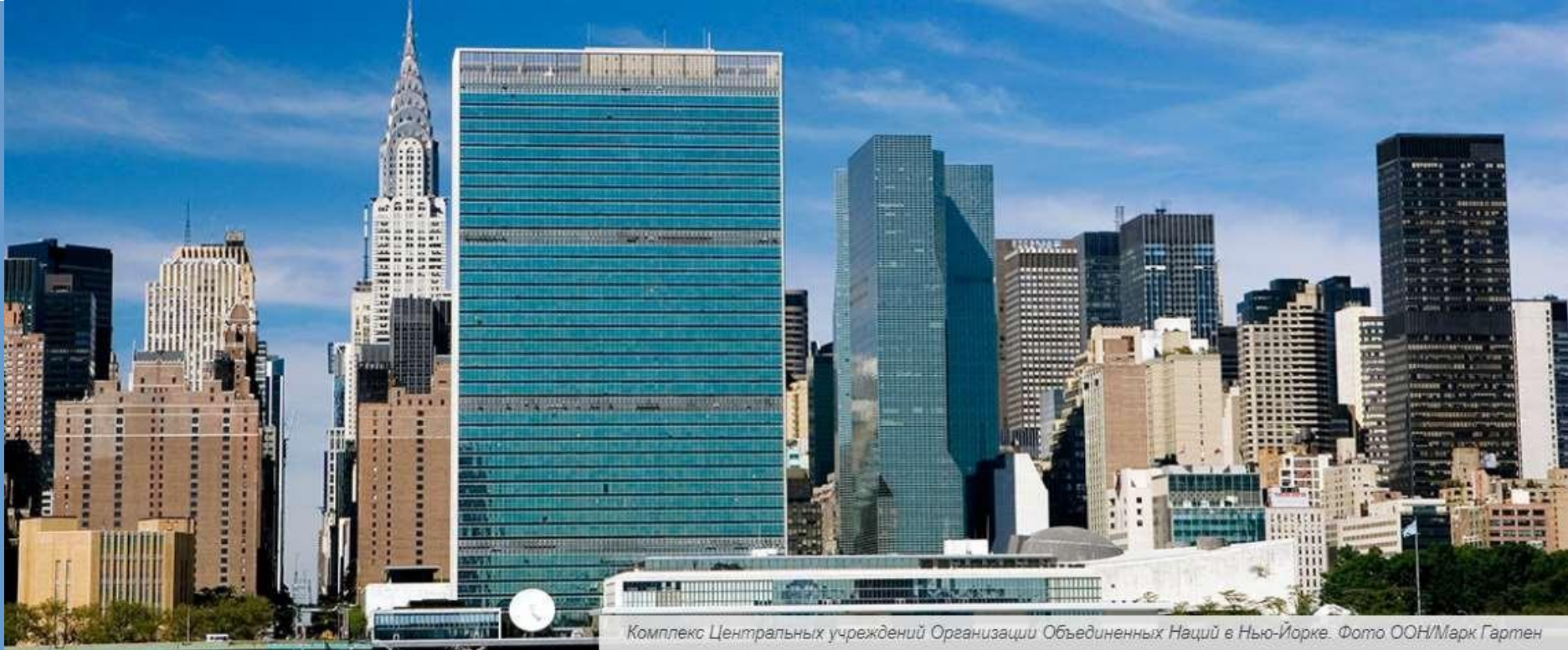
Комплекс Центральных учреждений Организации Объединенных Наций в Нью-Йорке.

Організація Об'єднаних Націй - це унікальна організація незалежних країн, які об'єдналися в ім'я загального миру і соціального прогресу.